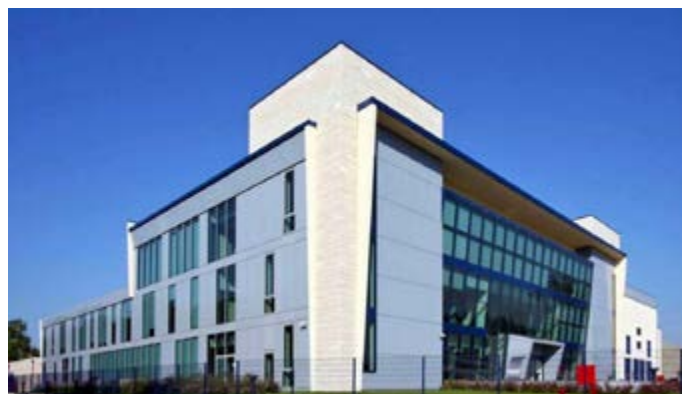
L'edificio che ospita il CNAO di Pavia e (sotto) il sincrotrone

Notizie tratte dal sito: https://fondazionecnao.it