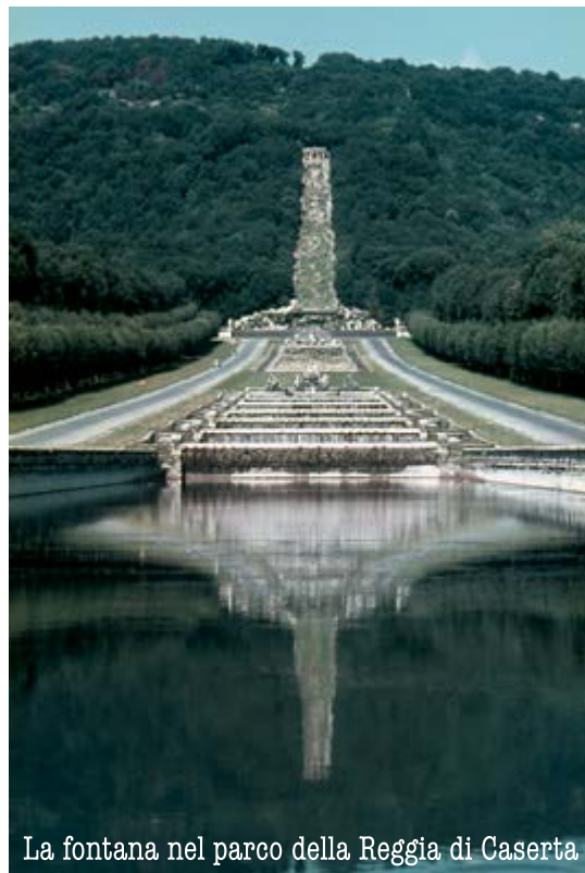
La fontana nel parco della Reggia di Caserta

Segnalare allergie ed eventuali incompatibilità alimentari.