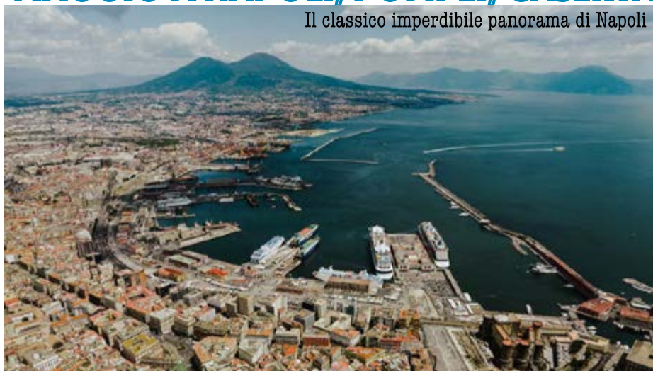
Il classico imperdibile panorama di Napoli

Mattinata a disposizione per le ultime visite libere con pullman privato a disposizione.