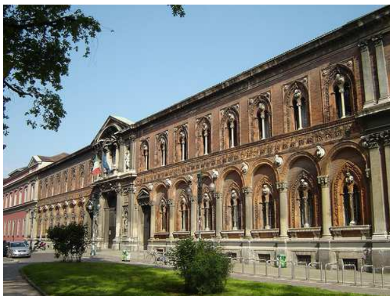
Milano - La facciata della Ca' Granda