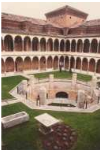
Ca’ Granda - Cortile della legnaia

La passeggiata prosegue e si conclude con la zona di via Laghetto,