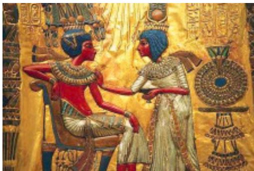
Museo Egizio - Trono dorato di Tutankhamon

Il museo risulta suddiviso in quattro piani (tre fuori terra e uno sotterraneo) con un percorso di visita cronologico.