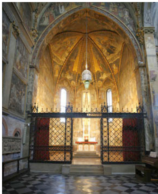
Duomo di Monza - Cappella di Teodolinda