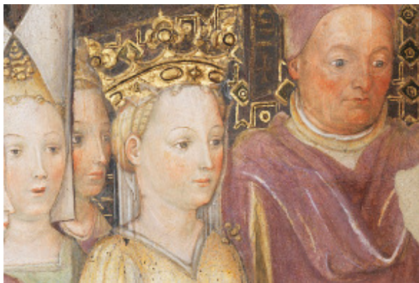
Nozze della Regina Teodolinda (particolare)

I numerosi episodi del grande affresco, come i balli, i banchetti, le feste, le battute di caccia, con una preziosa descrizione di abiti, acconciature, armi e armature, forniscono al visitatore uno straordinario spaccato della vita di corte a Milano nel XV secolo.