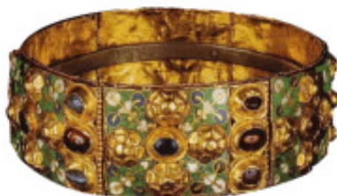
Monza - La Corona Ferrea

Le iscrizioni saranno accolte presso l'Ufficio informazioni di Santa Maria Gualtieri a partire dalle ore 9,00 di martedì 22 marzo.